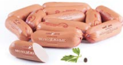
Шпикачки «Молодежные», охл.

Инд. упаковка – полиамид Транспортная упаковка – гофрокороб Вес короба, кг ≈ 3 Кол-во коробок на поддоне 120X80 – 80 Срок и условия реализации – при t от 0°C до 6°C не более 10 суток