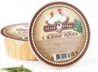
Паштет «Деликатесный» с зеленью укропа, охл. 90г

Инд. упаковка – банка ламистерная Транспортная упаковка – гофрокороб Кол-во вложений в короб – 12 Вес короба, кг – 1,08 Кол-во коробок на поддоне 120X80 – 200 Срок и условия реализации – при t от 0°C до 20°C – 24 месяца