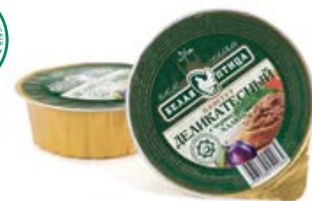
Паштет «Деликатесный» с черносливом Халяль, охл. 90г

Инд. упаковка – банка ламистерная Транспортная упаковка – гофрокороб Кол-во вложений в короб – 12 Вес короба, кг – 1,08 Кол-во коробок на поддоне 120X80 – 200 Срок и условия реализации – при t от 0°C до 20°C – 24 месяца