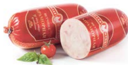
Ветчина «Мраморная», охл.

Срок и условия реализации – при t от 2°C до 6°C не более 9 суток