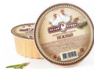
Паштет «Нежный» из куриного мяса, охл. 90г

Инд. упаковка – банка ламистерная Транспортная упаковка – гофрокороб Кол-во вложений в короб – 12 Вес короба, кг – 1,08 Кол-во коробок на поддоне 120X80 – 200 Срок и условия реализации – при t от 0°C до 20°C – 24 месяца