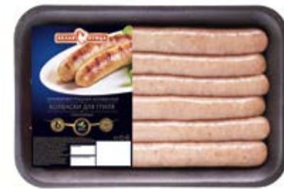
Колбаски для гриля «Охотничьи», охл., зам.