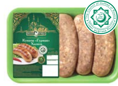
Купаты «Гурман» Халяль, охл., зам.