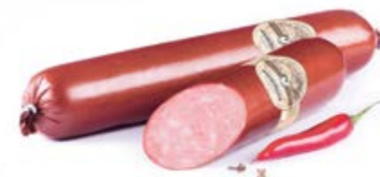
Колбаса «Филейная», охл.

Срок и условия реализации – при t не выше 12° не более 10 суток