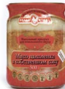
«Мясо цыпленка» в собственном соку 90г

Инд. упаковка – банка (стекло) Транспортная упаковка – гофрокороб Вес короба, кг – 8 Кол-во коробок на поддоне 120X80 – 50 Срок и условия реализации – при t от 0°C до 20°C – 24 месяца