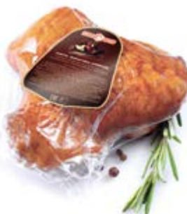
Бедро цыпленка-бройлера к/в, охл.

Срок и условия реализации – при t от 0°C до 6°C не более 30 суток