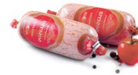
Паштет «Особый», охл. 140г

Инд. упаковка – полиамид Транспортная упаковка – гофрокороб Вес короба, кг – 2,24 Кол-во коробок на поддоне 120X80 – 80 Срок и условия реализации – при t от 2°C до 6°C не более 30 суток