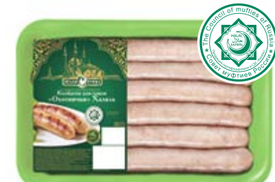
Колбаски для гриля Халяль «Охотничьи», охл., зам.