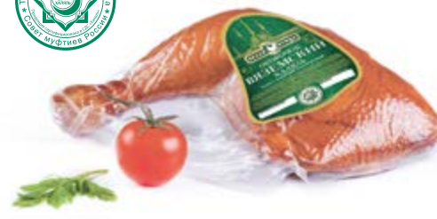
Окорочок цыпленка-бройлера к/в, охл. Халяль