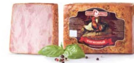
Рулет «Фирменный» в/у, охл.