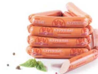
Сосиски «Куриные», охл. / зам.

Инд. упаковка – полиамид / вакуум / МГС Транспортная упаковка – гофрокороб Вес короба, кг ≈ 3 Кол-во коробок на поддоне 120X80 – 80 Срок и условия реализации – при t от 0°C до 6°C не более 15 / 20 / 20 суток