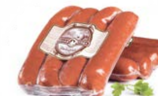
Колбаса «Швейцарская с сыром», охл.

Срок и условия реализации – при t не выше 12° не более 15 суток