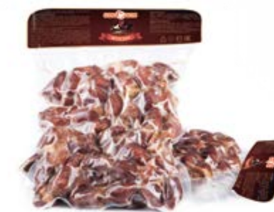
Желудки в/к, охл. 300г

Инд. упаковка – вакуум, 10 вложений Транспортная упаковка – гофрокороб Вес короба, кг – 3 Кол-во коробок на поддоне 120X80 – 80 Срок и условия реализации – при t от 0°C до 6°C не более 30 суток