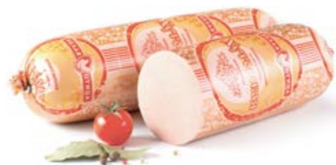
Колбаса «Хуторская», охл.

Срок и условия реализации – при t от 0°C до 6°C не более 6 суток