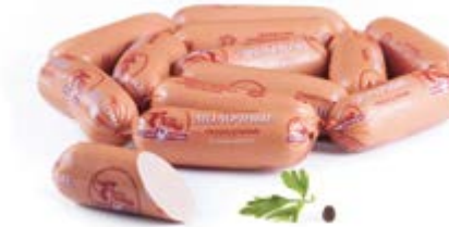
Сардельки «Молочные», охл.

Инд. упаковка – н/о, МГС, 1,5 кг / 2 вложения Транспортная упаковка – гофрокороб Вес короба, кг – 3 Кол-во коробок на поддоне 120X80 – 80 Срок и условия реализации – при t от 0°C до 6°C не более 15 суток