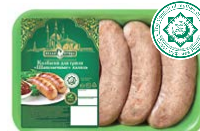
Колбаски для гриля Халяль «Шашлычные», охл., зам.