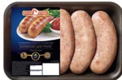
Колбаски для гриля «Шашлычные», охл., зам.