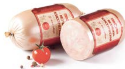
Ветчина «Классическая» из мяса птицы, охл.

Срок и условия реализации – при t от 0°C до 6°C не более 60 суток