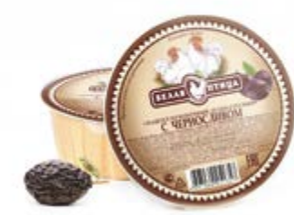
Паштет «Деликатесный» с черносливом, охл. 90г

Инд. упаковка – банка ламистерная Транспортная упаковка – гофрокороб Кол-во вложений в короб – 12 Вес короба, кг – 1,08 Кол-во коробок на поддоне 120X80 – 200 Срок и условия реализации – при t от 0°C до 20°C – 24 месяца