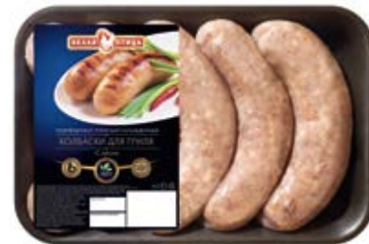
Колбаски для гриля «С луком», охл., зам.