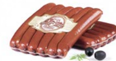
Колбаски «Пивные», охл.

Срок и условия реализации – при t от 0°С до 6°С не более 5 суток, в вакууме от 0°С до 6°С не более 15 суток