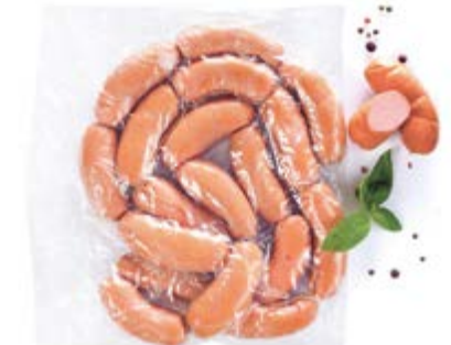
Сардельки «Молочные», охл.

Инд. упаковка – полиамид Транспортная упаковка – гофрокороб Вес короба, кг ≈ 3/6 Кол-во коробок на поддоне 120X80 – 80 Срок и условия реализации – при t от 0°C до 6°C не более 15 суток