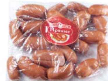
Шпикачки «Пряные», охл.

Инд. упаковка – полиамид Транспортная упаковка – гофрокороб Вес короба, кг ≈ 3 Кол-во коробок на поддоне 120X80 – 80 Срок и условия реализации – при t от 0°C до 6°C не более 10 суток