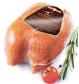
Грудка цыпленка-бройлера к/в, охл.