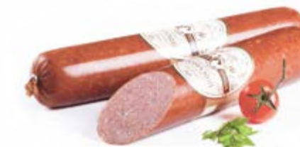
Сервелат «Боярский» в/к, охл.

Срок и условия реализации – при t от 5°C до 8°C не более 30 суток