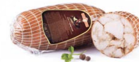
Рулет «Самарский» в/у, охл.

Срок и условия реализации – при t от 0°C до 6°C не более 10 суток