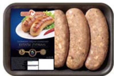
Купаты «Гурман», охл., зам.