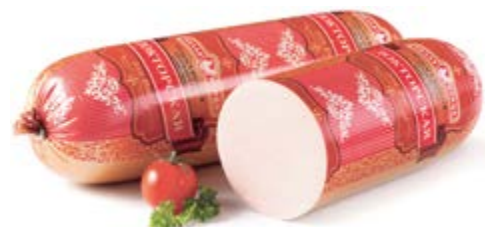
Колбаса «Докторская для Вас», охл.

Срок и условия реализации – при t от 0°C до 6°C не более 60 суток