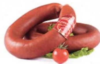
Колбаса «Краковская», охл.