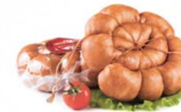
Колбаса «Куриная жареная», охл.

Срок и условия реализации – при t от 0°С до 6°С не более 30 суток