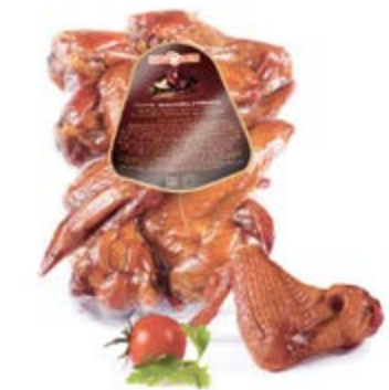
Крылышки цыпленка-бройлера к/в, охл.

Срок и условия реализации – при t от 0°C до 6°C не более 7 суток / при t от 0°C до 6°C не более 30 суток