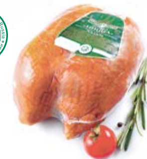
Грудка цыпленка-бройлера к/в, охл. Халяль