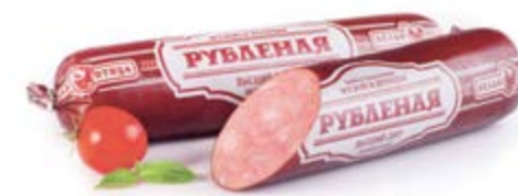
Колбаса «Рубленая», охл.

Срок и условия реализации – при t не выше 12° не более 15 суток