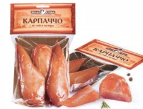
Карпаччо сыровяленое на подложке в/у, охл. 400г

Инд. упаковка – саше-пакет, МГС, 25 вложений Транспортная упаковка – гофрокороб Вес короба, кг – 0,75 Кол-во коробок на поддоне 120X80 – 80 Срок и условия реализации – при t от 0°C до 4°C не более 90 суток