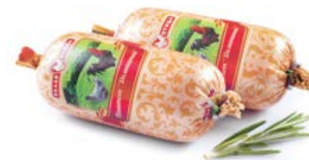
Паштет «Домашний», охл. 140г

Инд. упаковка – полиамид Транспортная упаковка – гофрокороб Вес короба, кг – 2,24 Кол-во коробок на поддоне 120X80 – 80 Срок и условия реализации – при t от 2°C до 6°C не более 30 суток