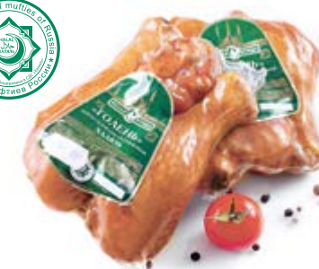
Голень цыпленка-бройлера к/в, охл. Халяль