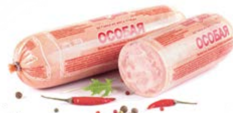
Ветчина «Особая», охл.

Срок и условия реализации – при t от 0°C до 6°C не более 8 суток