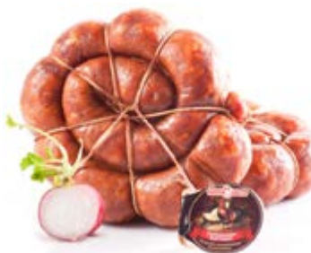
Колбаски «Украинские жареные», охл.

Срок и условия реализации – при t от 0°С до 6°С не более 30 суток