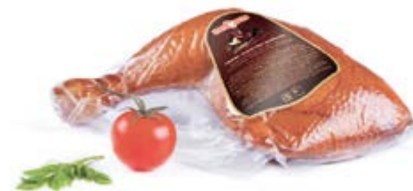
Окорочок цыпленка-бройлера к/в, охл.

Срок и условия реализации – при t от 0°C до 6°C не более 7 суток / при t от 0°C до 6°C не более 30 суток