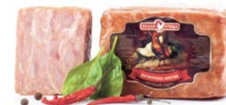
Колбаса «Закуска Деревенская», охл.

Срок и условия реализации – при t от 0°C до 6°C не более 6 суток