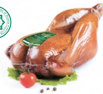
Тушка цыпленка-бройлера к/в, охл. Халяль