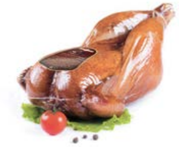
Тушка цыпленка-бройлера к/в, охл.