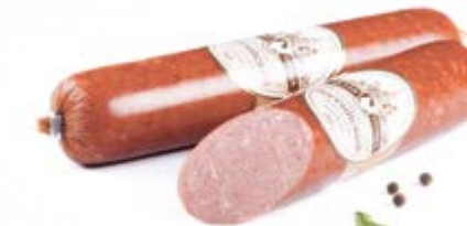
Сервелат «Российский» в/к, охл.

Срок и условия реализации – при t не выше 12°C не более 15 суток