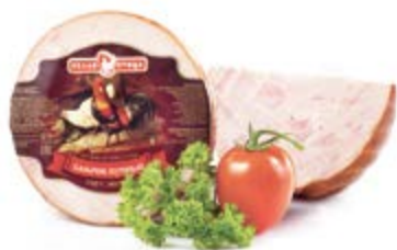
Ветчина «Балычок Куриный», охл.

Срок и условия реализации – при t от 2°C до 6°C не более 60 суток