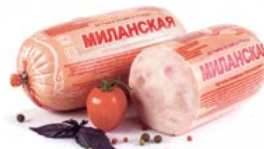
Ветчина «Миланская», охл.

Срок и условия реализации – при t от 0°C до 6°C не более 40 суток