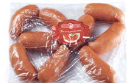
Сардельки «Белгородские», охл.

Инд. упаковка – полиамид / вакуум / МГС Транспортная упаковка – гофрокороб Вес короба, кг – 3/8 Кол-во коробок на поддоне 120X80 – 80/44 Срок и условия реализации – при t от 0°C до 6°C не более 15 / 20 / 20 суток / при t не выше -18°C не более 180 суток