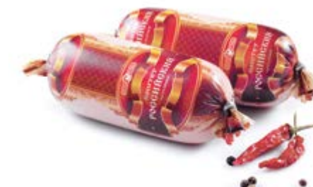
Паштет «Российский», охл. 140г

Инд. упаковка – полиамид Транспортная упаковка – гофрокороб Вес короба, кг – 2,24 Кол-во коробок на поддоне 120X80 – 80 Срок и условия реализации – при t от 2°C до 6°C не более 30 суток