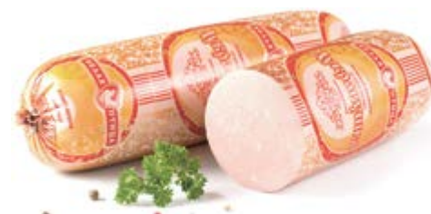
Колбаса «Дубравушка», охл.

Срок и условия реализации – при t от 0°C до 6°C не более 60 суток