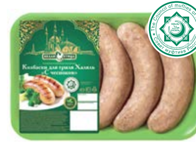
Колбаски для гриля «С чесноком» Халяль, охл., зам.