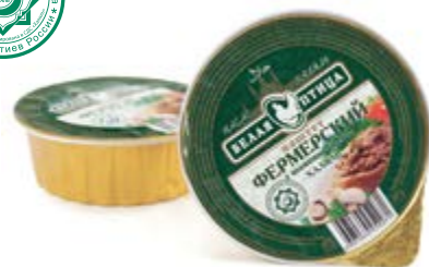
Паштет «Фермерский» с шампиньонами Халяль, охл. 90г

Инд. упаковка – банка ламистерная Транспортная упаковка – гофрокороб Кол-во вложений в короб – 12 Вес короба, кг – 1,08 Кол-во коробок на поддоне 120X80 – 200 Срок и условия реализации – при t от 0°C до 20°C – 24 месяца