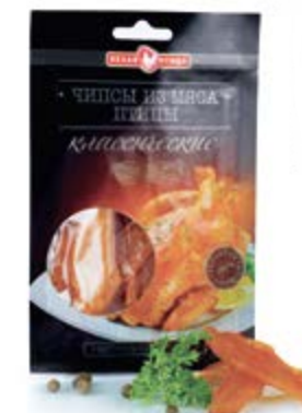
Чипсы сыровяленые из мяса птицы «Классические», охл. 30г

Инд. упаковка – кутизин, вакуум Транспортная упаковка – гофрокороб Вес короба, кг – 3 Кол-во коробок на поддоне 120X80 – 80 Срок и условия реализации – при t от 12°C до 15°C не более 120 суток