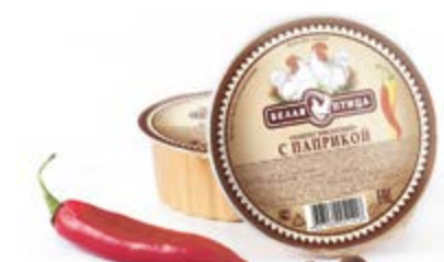
Паштет «Пикантный» с паприкой, охл. 90г

Инд. упаковка – банка ламистерная Транспортная упаковка – гофрокороб Кол-во вложений в короб – 12 Вес короба, кг – 1,08 Кол-во коробок на поддоне 120X80 – 200 Срок и условия реализации – при t от 0°C до 20°C – 24 месяца