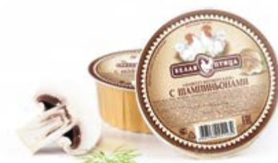
Паштет «Фермерский» с шампиньонами, охл. 90г

Инд. упаковка – банка ламистерная Транспортная упаковка – гофрокороб Кол-во вложений в короб – 12 Вес короба, кг – 1,08 Кол-во коробок на поддоне 120X80 – 200 Срок и условия реализации – при t от 0°C до 20°C – 24 месяца