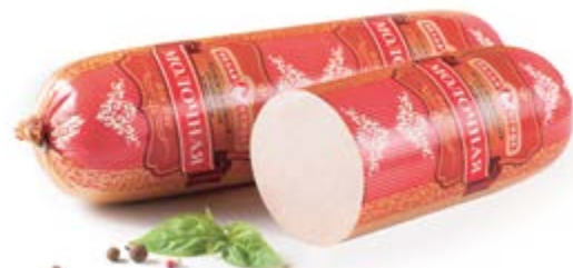
Колбаса «Молочная для Вас», охл.

Срок и условия реализации – при t от 0°C до 6°C не более 60 суток