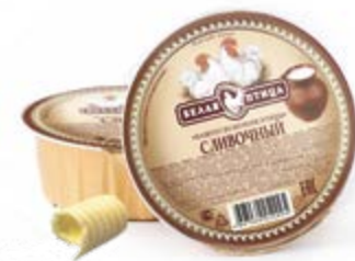
Паштет «Сливочный» из куриной печени, охл. 90г

Инд. упаковка – банка ламистерная Транспортная упаковка – гофрокороб Кол-во вложений в короб – 12 Вес короба, кг – 1,08 Кол-во коробок на поддоне 120X80 – 200 Срок и условия реализации – при t от 0°C до 20°C – 24 месяца