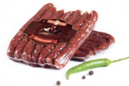
Колбаски сырокопченые «Курико» в/у, охл.

Инд. упаковка – кутизин, вакуум Транспортная упаковка – гофрокороб Вес короба, кг – 3 Кол-во коробок на поддоне 120X80 – 80 Срок и условия реализации – при t от 12°C до 15°C не более 120 суток