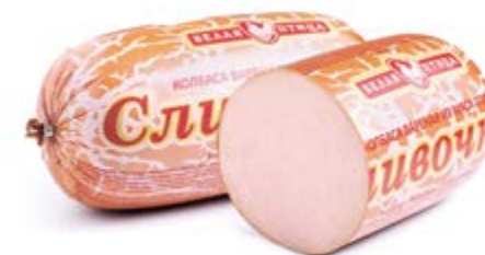
Колбаса «Сливочная», охл.

Срок и условия реализации – при t от 0°C до 6°C не более 60 суток