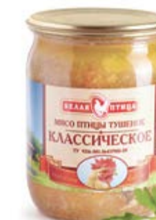
Мясо птицы тушеное «Классическое» 90г

Инд. упаковка – банка (стекло) Транспортная упаковка – гофрокороб Вес короба, кг – 8 Кол-во коробок на поддоне 120X80 – 50 Срок и условия реализации – при t от 0°C до 20°C – 24 месяца