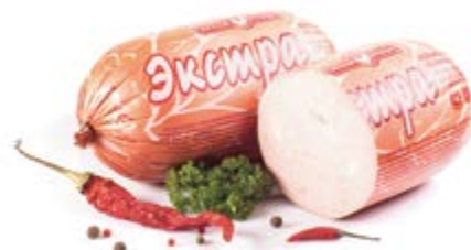
Колбаса «Экстра», охл.

Срок и условия реализации – при t от 0°C до 6°C не более 60 суток