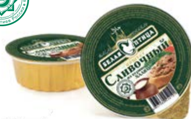
Паштет «Сливочный» из куриной печени Халяль, охл. 90г

Инд. упаковка – банка ламистерная Транспортная упаковка – гофрокороб Кол-во вложений в короб – 12 Вес короба, кг – 1,08 Кол-во коробок на поддоне 120X80 – 200 Срок и условия реализации – при t от 0°C до 20°C – 24 месяца