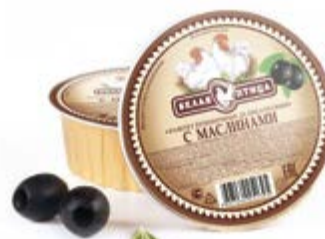
Паштет «Деликатесный» с маслинами, охл. 90г

Инд. упаковка – банка ламистерная Транспортная упаковка – гофрокороб Кол-во вложений в короб – 12 Вес короба, кг – 1,08 Кол-во коробок на поддоне 120X80 – 200 Срок и условия реализации – при t от 0°C до 20°C – 24 месяца