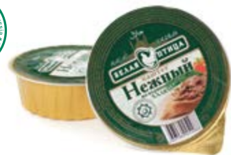
Паштет «Нежный» из куриного мяса Халяль, охл. 90г

Инд. упаковка – банка ламистерная Транспортная упаковка – гофрокороб Кол-во вложений в короб – 12 Вес короба, кг – 1,08 Кол-во коробок на поддоне 120X80 – 200 Срок и условия реализации – при t от 0°C до 20°C – 24 месяца