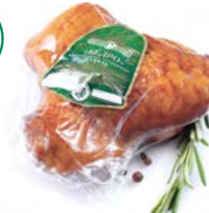
Бедро цыпленка-бройлера к/в, охл. Халяль