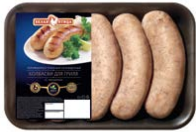
Колбаски для гриля «С чесноком», охл., зам.