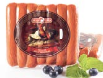
Сосиски «Ветчинные», охл.

Инд. упаковка – н/о, МГС, 1,5 кг / 2 вложения Транспортная упаковка – гофрокороб Вес короба, кг – 3 Кол-во коробок на поддоне 120X80 – 80 Срок и условия реализации – при t от 0°C до 6°C не более 15 суток