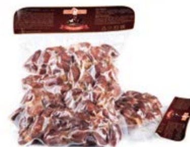
Сердечки в/к, охл. 300г

Инд. упаковка – вакуум (18 шт) Транспортная упаковка – гофрокороб Вес короба, кг – 7,2 Кол-во коробок на поддоне 120X80 – 80 Срок и условия реализации – при t от 5°C до 8°C не более 30 суток