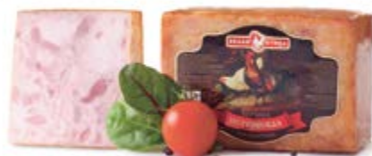
Ветчина «Петровская», охл.