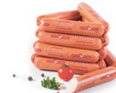
Сосиски «Нежные», охл.

Инд. упаковка – кутизин, вакуум, 8 вложений Транспортная упаковка – гофрокороб Вес короба, кг ≈ 3 Кол-во коробок на поддоне 120X80 – 80 Срок и условия реализации – при t от 0°C до 6°C не более 8 суток