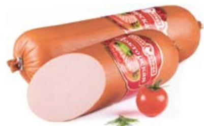
Колбаса «Докторская от Белой птицы», охл.