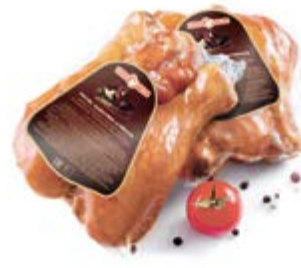
Голень цыпленка-бройлера к/в, охл.

Срок и условия реализации – при t от 0°C до 6°C не более 7 суток / при t от 0°C до 6°C не более 30 суток