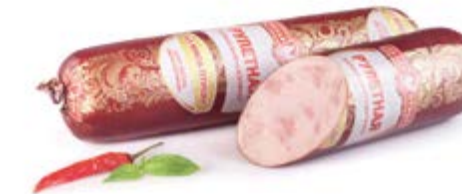
Колбаса «Рулетная» в/к, охл.